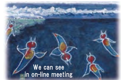
'Sea ice at Mombetsu' painted by Takao Nakajin