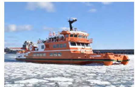
新型砕氷観光船:ガリンコ号Ⅲ