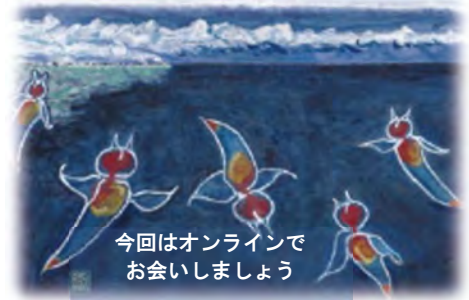
流水下で乱舞するクリオネ(中陣隆夫 画)